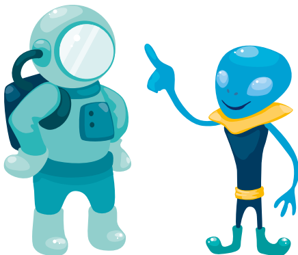
2. Zingxus, 12 alien